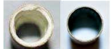
Dépôts calcaires dans une conduite d'eau avant la pose de l'activateur d'eau, puis quelques semaines après