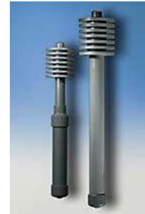
Beamers agricoles Weber-Bio 1:3 et 1:4 programmables avec leur couvercle dévissable