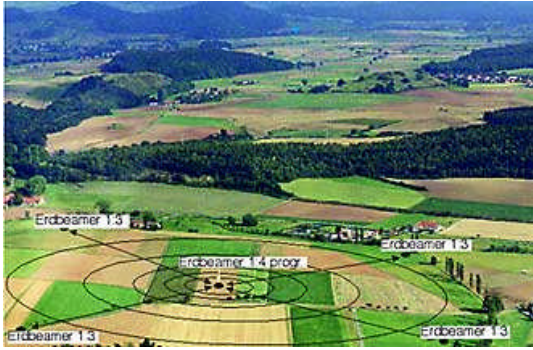
Schéma de présentation du rayon d'action de 300 mètres du Beamer agricole 1:4 pour une action sur plusieurs hectares de terrain agricole. 4 Maxi-Beamers non programmables installés en satellites entrent en résonance avec le Beamer programmable et retransmettent ses informations dans la totalité de leur périmètre d'action.