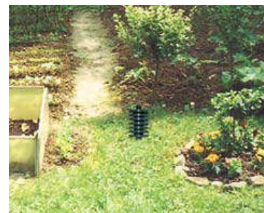
Beamer agricole installé dans le jardin, la tête doit dépasser de la terre