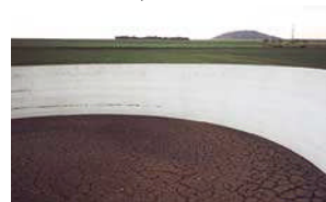
Lisier sans Vitaliseur, forte croûte flottante